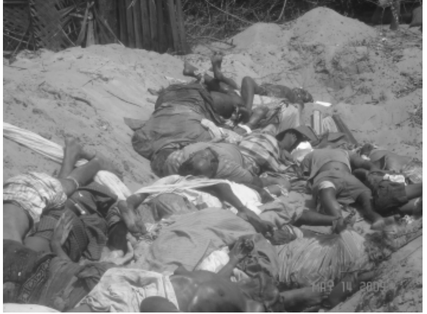
ஈழத்தில் 14 மே, 2009 அன்று இனப்படுகொலைக்கு ஆளான தமிழர்கள் : கேட்பதற்கு நாதியில்லை

அண்மையில் நடைபெற்ற சோக நிகழ்வாக, இந்திய குடியரசுத் தலைவர் இலங்கை குடியரசுத் தலைவருக்கு வாழ்த்து தெரிவித்துள்ளார். இலங்கையுடன் இணைந்து இந்தியா செயல்படும் என்றும் கூறியுள்ளார். இது, ஏற்றுக் கொள்ள முடியாத ஒன்று. 30 ஆயிரம் தமிழர்களின் பிணங்களின் மீது ஏறி நின்று அவர்கள் செயல்படப் போகிறார்கள். சீனா இலங்கையுடன் இணைந்து செயல்படுகிறது. பாகிஸ்தான் இலங்கையுடன் நட்பு பாராட்டுகிறது. இந்நிலையில் இந்தியாவில் தமிழ்நாட்டில் உள்ள ஆறரை கோடி தமிழர்கள் கிளர்ந்தெழுந்து, இந்திய அரசை நிர்பந்திக்க வேண்டும். அண்மையில் நடந்து முடிந்த இனப்படுகொலையின் போது நிகழாத அது இப்போது முதல் நிகழ வேண்டும்.